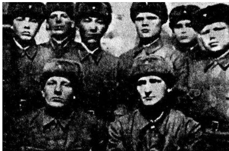
Курсанты-тюменцы. 1942 г.