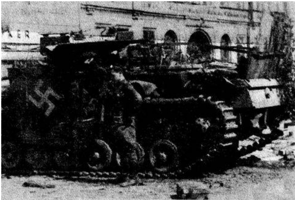
Комсорг полка у подбитого немецкого танка, 1944 г.

В первую очередь следовало определить, с какими силами противника мы имеем дело и каковы его планы, собирается ли он продолжать отступление или постарается закрепиться и превратить Неман в новую преграду для наступающих. На рассвете полковник решил послать разведчиков в сторону Гродно. Я вызвался возглавить группу.